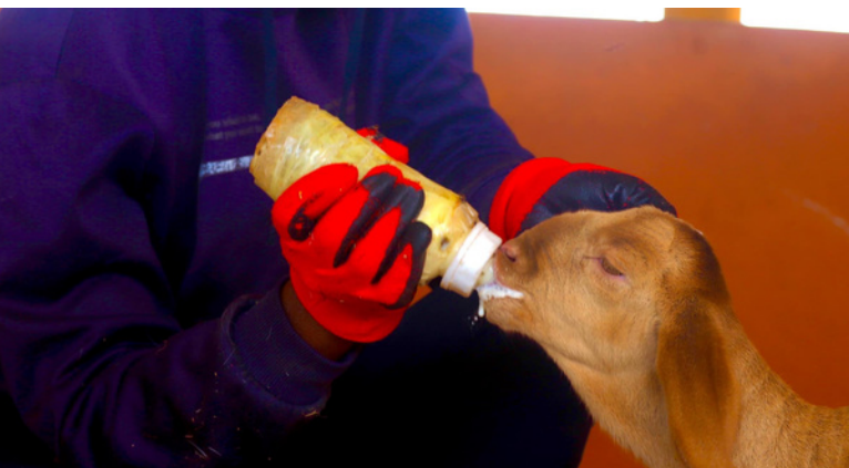
La ferme agro-écologique de Hahatay Gandiol pour la formation des jeunes

L'une des associations qui m'a le plus marqué cette année est Hahatay de Gandiol . Créée dans un contexte de destruction de l'écosystème du Gandiol avec la brèche, Hahatay , avec ses collaborateurs et partenaires, a réussi à développer des outils d'actions communautaires pour faire face à l'adaptation et la résilience.