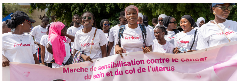
Mobilisation des volontaires de l'association Fore Hope pour lutter contre le cancer chez les femmes

Certes, elles ont besoin d'accompagnement mais elles sont incontournables dans la résilience des communautés et dans la réalisation des ODD. Des objectifs qu'elles partagent avec les entreprises et les autres acteurs au développement de nos territoires.