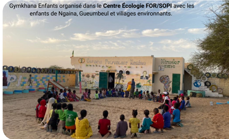
Gymkhana Enfants organisé dans le Centre Écologie FOR/SOPI avec les enfants de Ngaina, Gueumbeul et villages environnants.

Initié depuis 2016 par l'association Hahatay , le Festival Taaru Gandiol , c'est plus d'une semaine d'activités (22-31/12/2023) visant à valoriser nos réalisations et celles des hommes et des femmes évoluant dans différents domaines : culture, commerce, transformation, couture , etc. Cette année, avec nos collaborateurs, partenaires et la population locale, nous avons valoriser l' esprit créatif des acteurs du territoire à travers différentes activités et animations .