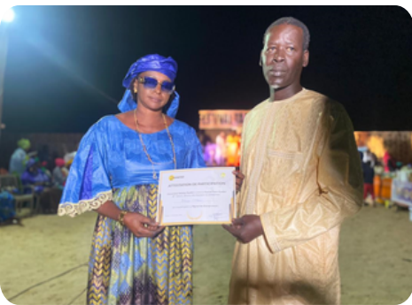
Remise des attestations de participation + foire des entrepreneurs locaux et des GIE de femmes

Cette huitième édition du Festival a rassemblé toute la communauté de Gandiol pour repousser les limites de la créativité , célébrant la diversité , l' innovation et l' esprit communautaire qui font du festival un rendez-vous exceptionnel qui "rassemble et unit les forces locales" .