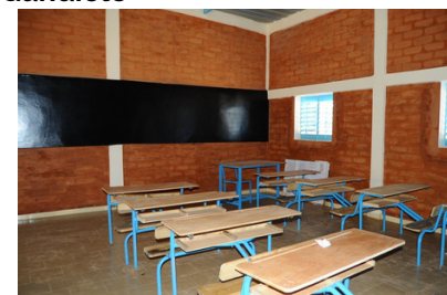
Des constructions écologiques pour garantir de bonnes condition d'études