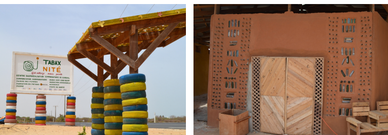
Construction d'un espace de vie autonome et écologique à base d'argile

Mieux connaître le projet sur : https://hahatay.org/