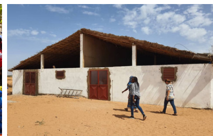
Promouvoir l'entrepreneuriat des femmes chez Cfao Retail