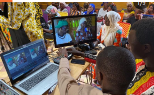
Des jeunes formés aux métiers des multimédias

Promouvoir l'autonomisation des femmes, leur visibilité et leurs droits dans la communauté, et valoriser leurs initiatives.