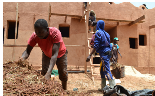
De l'argile pour bâtir nos bâtiments de demain