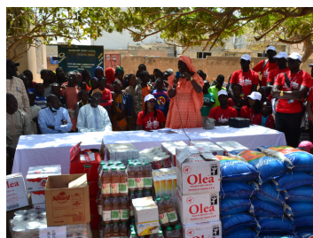
L'éducation pour tous chez Auchan Sénégal

Du mécénat ; Que du social ; Que du greenwashing ou un variable d' ajustement ; Que l'affaire des grandes entreprises .