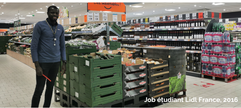
Job étudiant Lidl France, 2016

Mon vécu sur le terrain et mes expériences professionnelles m'ont donné envie de m'ériger pour éclairer la lanterne des consommateurs qui s'avèrent être, la plupart du temps, peu informés.