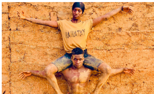
Création artistique mixte autour de l'agile