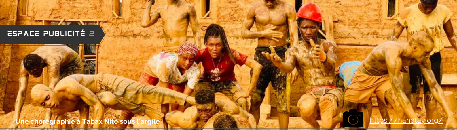
Une chorégraphie à Tabax Nité sous l'argile